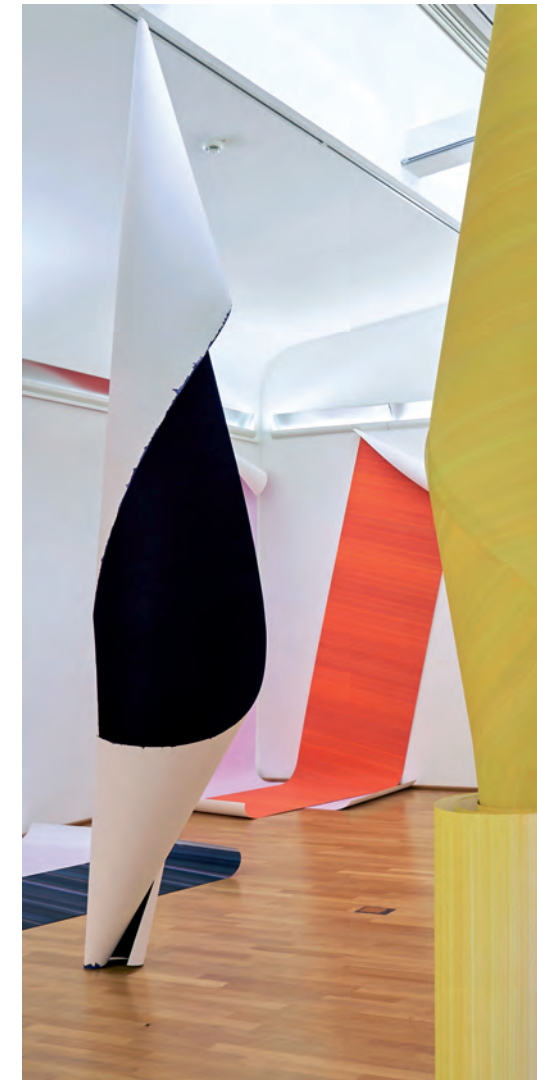
Elisabeth Sonneck Rollbild5 Rotation Orange Öl auf Papier, je 110x500cm, Kunstmuseum Ahlen (D), 2015