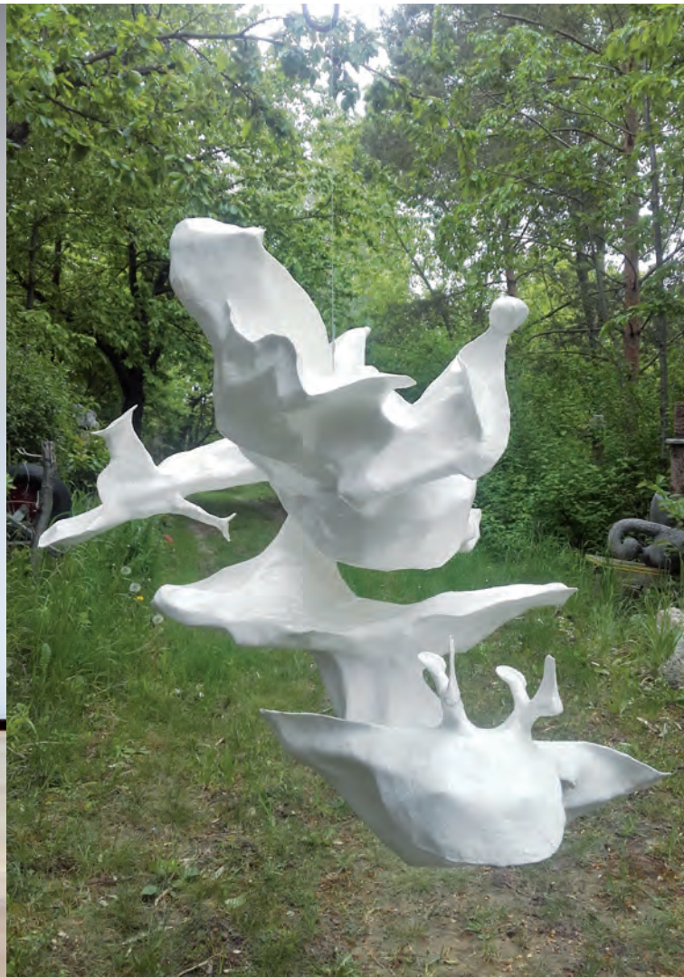
Peter Dörlinger o.T. 2014, Papier, Leim, 70 x 65 x 87 cm