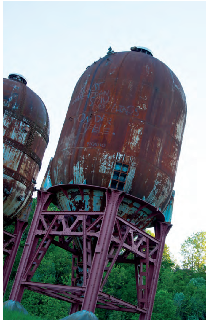
Papiermachermuseum Steyermühl, Zellstoffkocher