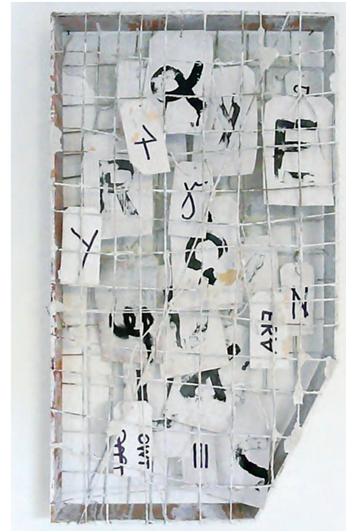
Walter Weer Verstummen 2016, Karton, Papier, Schnur, bemalt, 80 x 45 x 8 cm