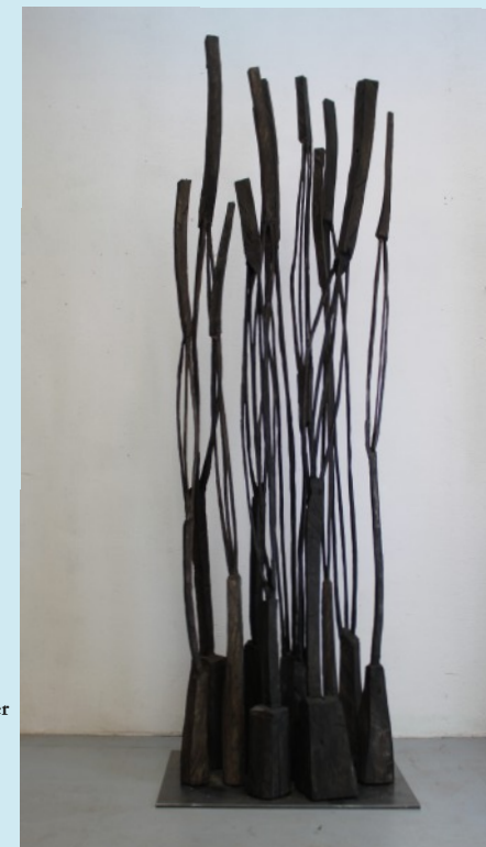
Armin Göhringer o.T. 2018, Holz, geschwärzt 250 x 60 x 80 cm