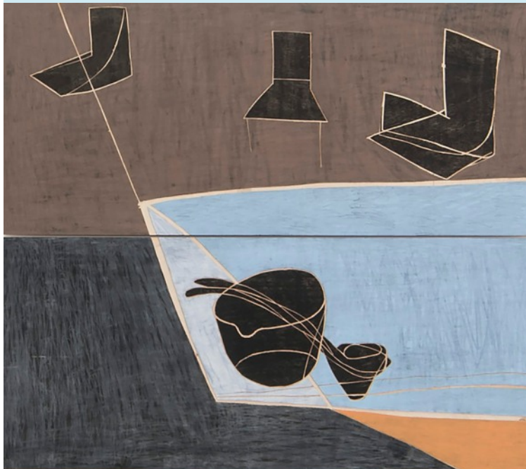
Martina Geist Mahlzeit I 2008, Öl auf Holz, 2-teilig je 95 x 220 cm